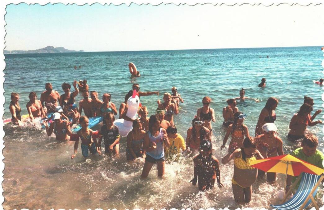
Pozdrav z dovolené

Děti, které prožívají rekondiční pobyt se Slunečním paprskem na Rhodosu i děti, které jsou s Olomockou Šancí na táboře nám poslaly krásné pozdravy. Moc za ně děkujeme.